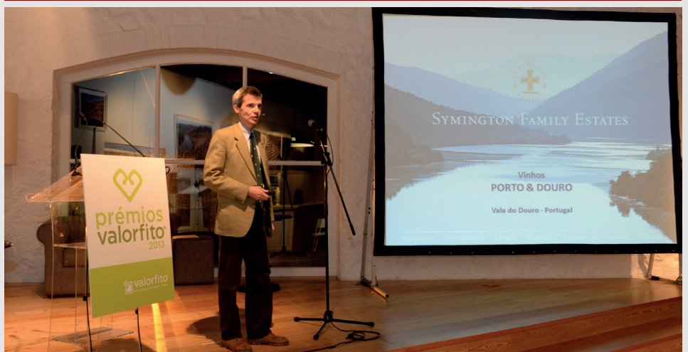
A família Symington é um dos maiores vitivinicultores do país, com 26 quintas espalhadas pelo Vale do Douro, num total de 986 hectares de vinha e 9 adegas próprias