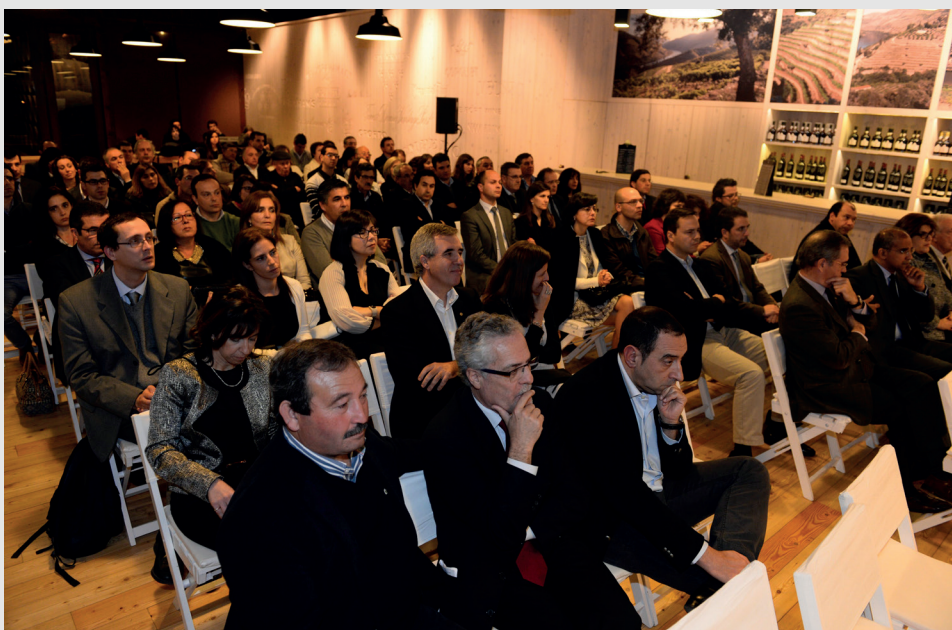
A cerimónia de entrega dos Prémios Valorfito 2013 contou com a presença de individualidades oficiais como a Anipla, a Groquifrar, a DGAV, a APA, a Confagri e a CAP

A Valorfito@ctual mostra-lhe os vencedores e os melhores momentos da cerimónia dos Prémios Valorfito 2013. Acompanhe nas páginas seguintes. » pág. 3