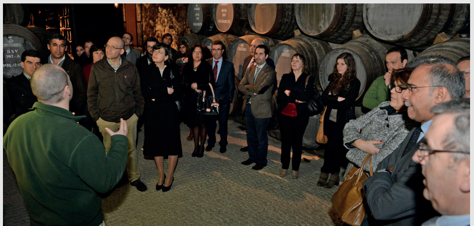
Visita guiada às caves Graham's, propriedade da família Symington há cinco gerações

O troféu relativo ao Prémio de 2013 foi executado por adultos com deficiência mental, utentes da APERCIM, uma instituição do concelho de Mafra. A verba destinada ao PRÉMIO INVESTIMENTO, que não recebeu candidaturas, foi entregue pelo Valorfito a uma instituição de solidariedade social.