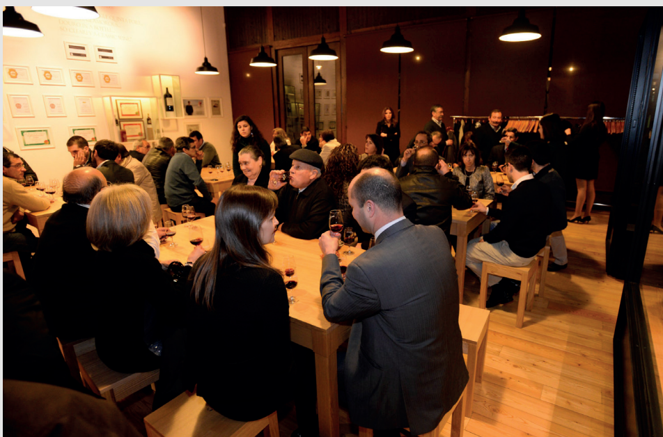
Prova de Vinho do Porto após a visita às Caves Graham's